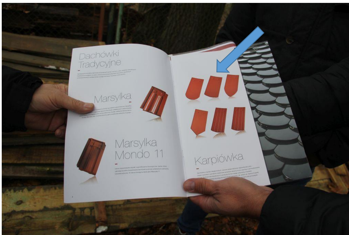
Pod kształt oryginalnej dachówki wybrano kształt i kolor nowo wykonanej dachówki firmy Wienerberger podczas spotkania z wykonawcą, kierownikiem i architektem dnia 23.11.2023 r.