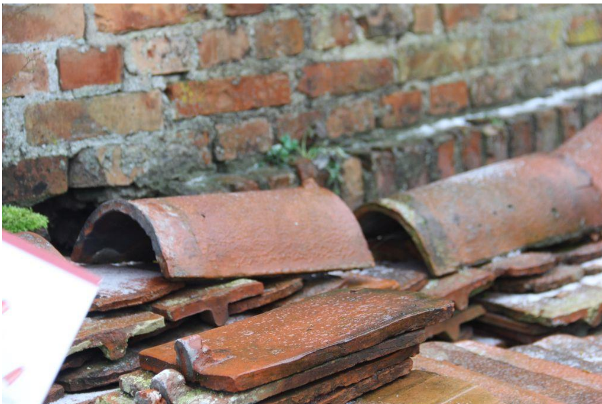
Gąsior oryginalny ze spichrza zbożowego