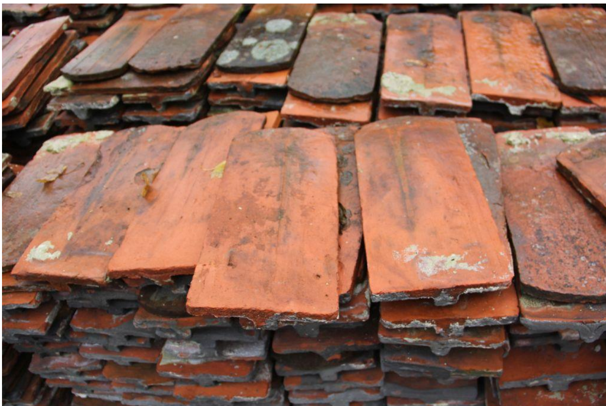
Oryginalne dachówki zgromadzone na stosie.